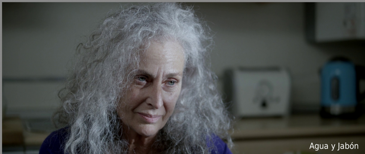
Agua y Jabón