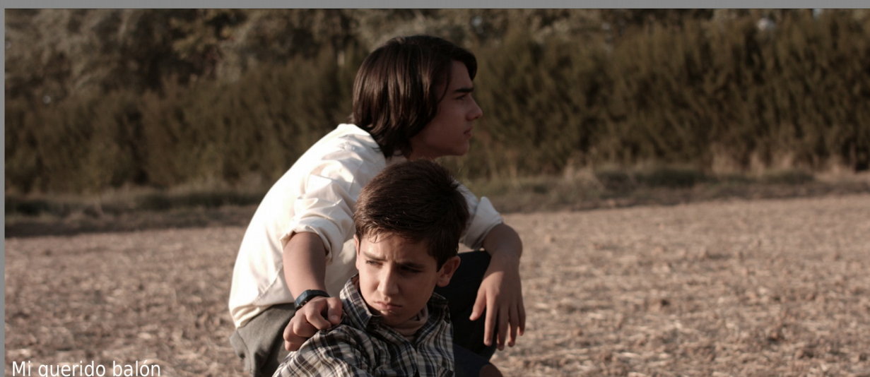
Mi querido balón

Nuestra inquietud era saber que respuesta podía tener el público ante una propuesta comprometida, el resultado fue muy positivo y comenzamos el lanzamiento de la Primera Muestra de Cine Social con un planteamiento de recepción de trabajos nacionales e internacionales y elegimos el mes de noviembre para su proyección. En la segunda semana de noviembre de 2013 proyectamos una selección de 30 cortometrajes seleccionados de entre los ciento ochenta recibidos.